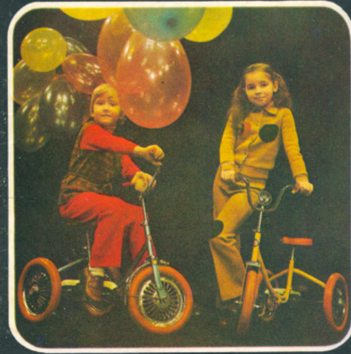
ДЕТСКИЙ ВЕЛОСИПЕД «СПАРТЕ-3»