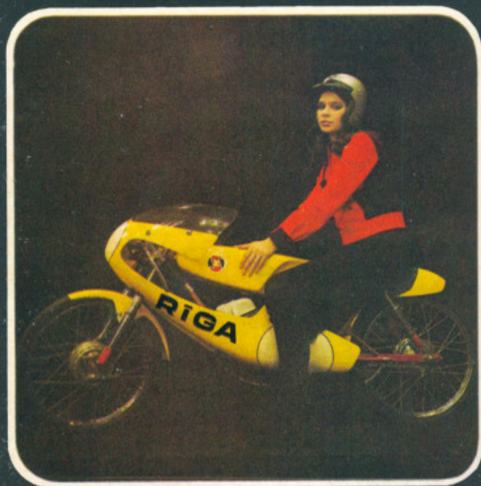
ГОНОЧНЫЙ МОТОЦИКЛ «РИГА-15-С»