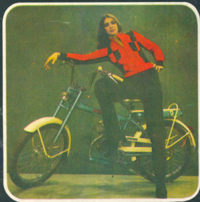
ЛЕГКИЙ МОПЕД «РИГА-17»